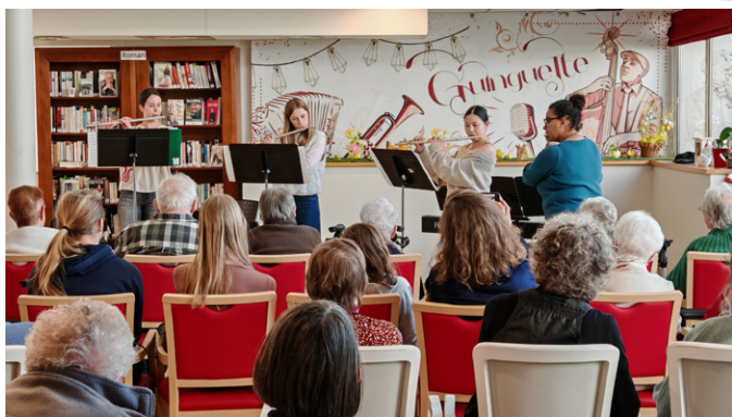
Les élèves de l'école de musique Poly-Sons se sont produits devant les résidents des Trois Moulins