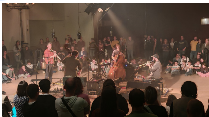
Concert du groupe «No Tongues» avec les élèves du collège Saint-Augustin