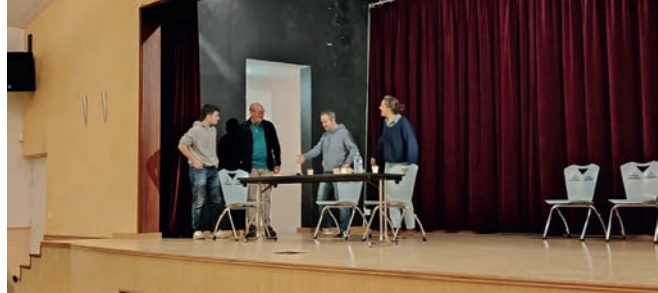
Théâtre participatif « Mon voisin l'agriculteur » organisé par la MSA le mardi 18 novembre à la salle de la Riante Vallée.