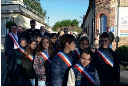
Les enfants du Conseil Municipal des Jeunes ont participé à la commémoration du 11 novembre.