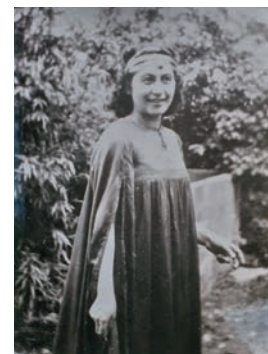
Marinette à 22 ans

Elle est née à la Poitevineière, dans une ferme de 32 ha que tenaient ses parents, locataires du comte de Durfort. A pied, elle fréquente l'école Notre-Dame jusqu'à 14 ans, année du certificat d'étude primaire. C'est un échec. Elle fait une faute qui la privera de son examen. « A cause de cela, nous dit-elle, je suis devenue la honte de la famille. » Elle se promet alors de se retrouver toujours dans les meilleures.