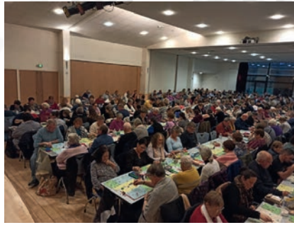
La concentration était de mise lors du loto organisé par l'APEL de l'école Notre-Dame le dimanche 23 novembre à la salle de la Riante Vallée.