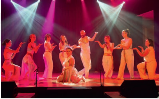
Spectacle de variétés «Si on changeait ??!» à la salle de la Riante Vallée.