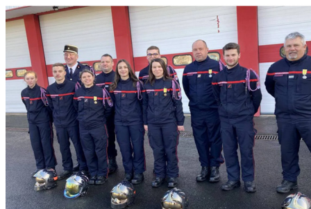
Cérémonie de la Sainte-Barbe le samedi 10 janvier 2026