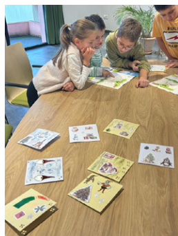
Le Conseil Municipal des Jeunes a distribué des cartes de vœux aux personnes isolées