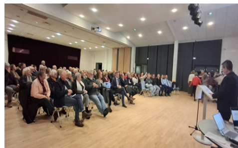
Cérémonie des vœux de la municipalité le vendredi 16 janvier 2026

Restez informés grâce à notre application IntraMuros et à notre site internet :