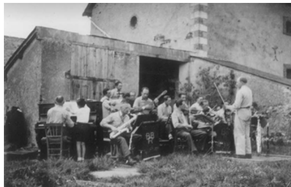
Concert du commando allemand 1947 à "la Basse Cour" (Collection M lle Marie BEAUJARD de Riaillé)

Au printemps 1947, les prisonniers dont plusieurs étaient de bons musiciens, donnèrent un concert à l'air libre dans la propriété DENÉCHAU. Plus d'une cinquantaine de Riailléens vinrent y assister. Ces prisonniers furent apparemment libérés au courant du second semestre 1947.