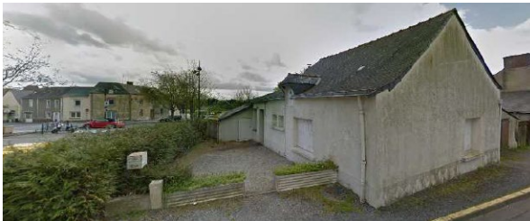
La maison avant sa démolition

Depuis quelques semaines, le visage de la place de l'Écheveau a changé. La maison acquise par la commune a été démolie, libérant un espace qui ouvre de nouvelles perspectives pour le centre-bourg.