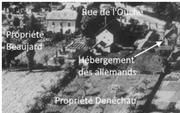
Photo aérienne de Riaillé vers 1950 avant les transformations de 1966 (Carte postale semi-moderne,

Seize prisonniers allemands 1 furent attribués à la commune de Riaillé en 1945 pour constituer un commando à sa disposition. La propriété de la "Basse Cour" 2 du 9 rue de l'Ouche de M. DENÉCHAU fut réquisitionnée pour les accueillir. Ils logeaient dans le bâtiment du fournil 3 côté rue de l'Erdre alimenté seulement en électricité.