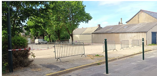
Espace libéré suite à la démolition de la maison

À ce stade, rien n'est arrêté. Notre volonté est de prendre le temps nécessaire pour imaginer un aménagement cohérent avec les besoins des habitants et la vie du centre-bourg.