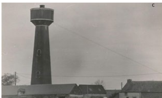
Château d'eau du Haut-Rocher édifié par les prisonniers allemands

L'eau de la source de la Fontaine Minérale fut captée, amenée dans un château d'eau (détruit en 1988) au Haut-Rocher, puis distribuée sur place et dans le bourg. Ces travaux de construction et d'acheminement furent réalisés par les prisonniers allemands.