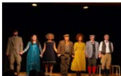
La troupe des Accroscène a voyagé autour du monde en 80 jours !