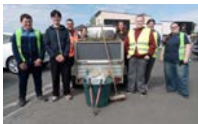
Les jeunes participants de l'opération « Argent de Poche » qui s'est tenue en avril.