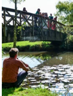
Balade musicale du 19 septembre 2025 dans le cadre de l'animation «No Tongues» organisée par la Communauté de Communes du Pays d'Ancenis