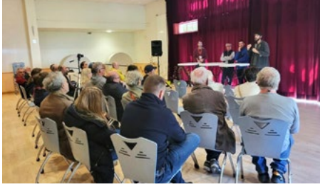
Conférence lors de l'événement «d'Arbre en Arbres» des 4 et 5 octobre à la salle de la Riante Vallée