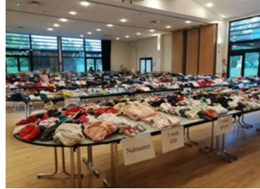
La bourse aux vêtements et aux jouets organisée par l'Amicale Laïque «les P'tits Doisneau» le samedi 25 octobre, à la salle de la Riante Vallée, a fait le plein !