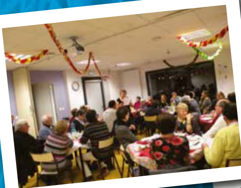
Réveillon solidaire du 24 décembre dernier, à la salle paroissiale