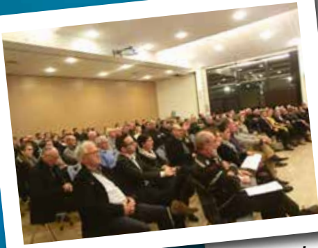
Vœux de la municipalité le 03 janvier dernier à la salle de la Riante Vallée

Don du Sang (salle de la Riante Vallée, 16h30-19h30)